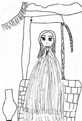
A samáriai asszony (Papp Veronika rajza)